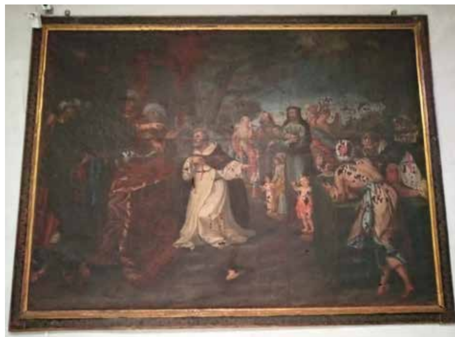
Fig. 1. Rescate de Jesús de Medinaceli en Mequínez, anónimo, principios del siglo XVIII. Iglesia de los PP. Trinitarios de Córdoba.

TE EN PRINCIPAL DIFUSORA DEL RESCATE DE IMÁGENES ES LA TALLA DE JESÚS DE MEDINACELI. EN TORNO A SU RECUPERACIÓN POR PARTE DE LOS TRINITARIOS SE VAN A LLEVAR A CABO NUMEROSAS OBRAS PICTÓRICAS QUE TRATARÁN DE NARRAR LOS HECHOS OCURRIDOS EN EL NORTE DE ÁFRICA. UN GRAN DESCONOCIDO PARA LA PINTURA RELACIONADA CON ESTE RESCATE ES EL CUADRO RESCATE DE JESÚS NAZARENO (FIG. 1), EXISTENTE EN EL ACCESO AL CAMARÍN DE JESÚS NAZARENO RESCATADO , EN EL CONVENTO DE PADRES TRINITARIOS DE CÓRDOBA. SE TRATA DE UNA OBRA DE GRANDES DIMENSIONES (2,70 x 2,05 M) 1 , QUE REPRESENTA EL MOMENTO EN EL QUE LOS FRAILES TRINITARIOS NEGOCIAN EL RESCATE DE JESÚS DE MEDINA-