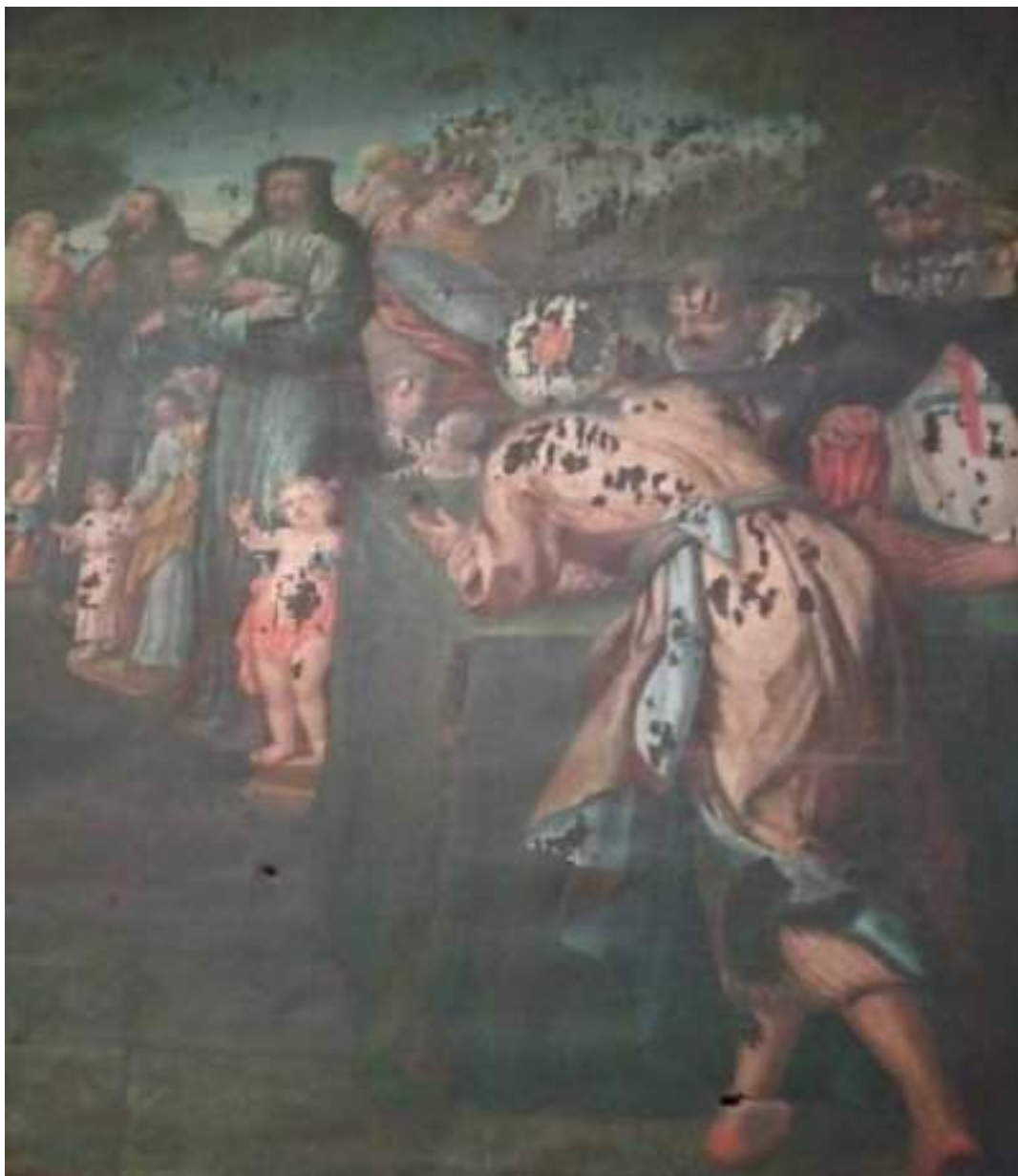
Fig. 4. Rescate de Jesús de Medinaceli en Mequínez, anónimo, principios del siglo XVIII. Iglesia de los PP. Trinitarios de Córdoba.

CISIETE IMÁGENES EN MEQUÍNEZ, ENTRE 1681 Y 1682. DEBIDO A LA MALA CONSERVACIÓN DE LA OBRA, RESULTA COMPLICADO IDENTIFICAR CON EXACTITUD