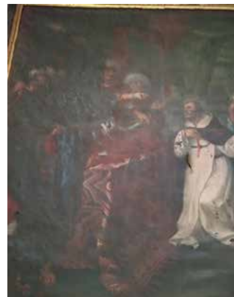
Fig. 2. Rescate de Jesús de Medinaceli en Mequínez, anónimo, principios del siglo XVIII. Iglesia de los PP. Trinitarios de Córdoba.

SIN EMBARGO, NO PARECE QUE LA PINTURA QUE ESTAMOS TRATANDO TENGA RELACIÓN CON LAS DE LA NAVE PRINCIPAL, YA QUE SE DESMARCA DE LA VIDA DE SAN JUAN BAUTISTA Y NO PRESENTA EL MISMO TIPO DE MARCO; AUNQUE BIEN ES CIERTO QUE PODRÍA HABERSE ENCARGADO AL MISMO TALLER QUE LAS OTRAS PINTURAS, SIN TENER QUE PRESENTAR LAS MISMAS CARACTERÍSTICAS. LA PINTURA DEL RESCATE TAMBIÉN HA SIDO INCLUIDA EN EL LOTE DE CUADROS QUE PRETENDEN SER RESTAURADOS POR EL CONVENTO; POR TANTO, HASTA QUE NO SE LLEVE A CABO LA NECESARIA RESTAURACIÓN DE ESTA PINTURA NO PODREMOS SABER SI EN REALIDAD FUE REALIZADA EN EL MISMO TALLER QUE LAS PINTURAS DE LA NAVE PRINCIPAL, SI SE ABREN OTRAS HIPÓTESIS O SI NO SE DESCUBRE NADA MÁS.