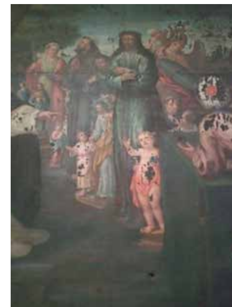
Fig. 3. Rescate de Jesús de Medinaceli en Mequínez, anónimo, principios del siglo XVIII. Iglesia de los PP. Trinitarios de Córdoba.